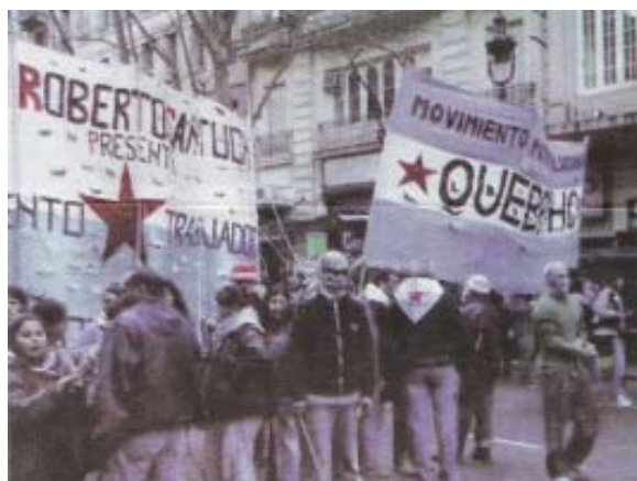
Organización «Quebracho» y otra que reivindica al desaparecido jefe del ERP, Roberto Santucho, en la Movilización a la Embajada de Israel

vertiente del marxismo eran judíos paranoicos con la religión del holocausto. La mayoría de sus exponentes guardan un reverente respeto por el sionismo y sus ideas emblemáticas. A éstos no les parece que dicha ideología sea algo autoritaria y represiva. No les parece que, en su caso, la sociedad israelí constituya una sociedad basada en la discriminación de base religiosa y racial, ni violatoria de los derechos humanos. Nada les sugiere el hecho de que se torture con permiso normativo y judicial o que en las cárceles se mantenga a presos políticos y sociales (palestinos) en situaciones degradantes, como suelen denunciar organizaciones de derechos humanos internacionales. Consideran al Estado de Israel una sociedad abierta, pluralista y democrática. Podemos leer este tipo de alegatos en Marcos Aguinis, lectura común hoy en día entre liberales y progres . Con el judaísmo y su entidad Sionista, todo bien.