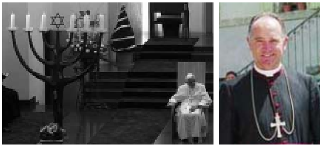
B XVI primero visita las Sinagogas, luego recibe al Superior de la FSPX (Mons. Fellay) y anunciaría la «liberación» de la Misa «de San Pío V»...

que fuera solicitada por los fieles al obispo de la diócesis donde se quería celebrar, petición que podía ser aceptada o rechazada».