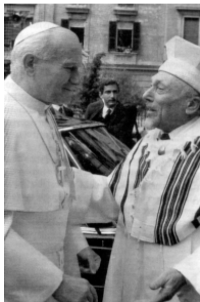
Juan Pablo II y el gran rabino Toaff

Establecer la profundidad de estas influencias recíprocas permanece una cuestión abierta. Después de haber recordado las relaciones más que amistosas de su juventud con la comunidad judía de Wadowice (48), y las mantenidas más tarde como obispo con la comunidad de Cracovia, Juan Pablo II declara a Vittorio Messori: « Elegido a la Sede de Pedro, conservo en el fondo del alma aquellas cosas que tienen raíces muy profundas en mi vida. Con ocasión de mis viajes apostólicos por el mundo, busco siempre encontrarme con los representantes de las comunidades judías. Pero la visita a la sinagoga de Roma fue para mí, sin ninguna duda, una experiencia absolutamente excepcional. (...) Durante aquella visita memorable, definí a los judíos como hermanos mayores en la fe. Estas palabras resumen cuanto ha dicho el Concilio, y que no puede no ser una profunda convicción de la Iglesia. (...) Este pueblo extraordinario lleva siempre en sí los signos de la elección divina. (...) Es verdad que Israel pagó muy caro su 'elección'. Es quizás gracias a esto, que se ha hecho más semejante al Hijo del hombre... » (49). Para todos aquellos que, como nuestros lectores, conocen el pensamiento de Mickiewicz sobre el pueblo