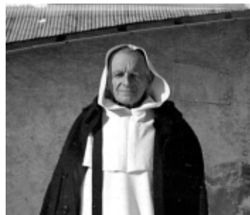
El Padre Guérard des Lauriers O.P.

De esta última observación resulta la siguiente consecuencia: Recordemos que la «aplicación» del mérito no es necesaria (o « de condigno »), más que en dos casos; a saber: 1) Esta «aplicación» es hecha por Cristo en persona. Él, y solo Él, merece en derecho por otro. 2) Esta «aplicación» es hecha por la misma persona que adquiere el mérito: cada mérito « de condigno », por sí mismo. Entonces, como la aplicación del fruto de la Misa es hecha en derecho por la persona moral que constituyen unidamente (« una cum ») la Iglesia y el Papa, es necesario que esta misma persona moral esté en el principio del Sacrificio del cual tiene el derecho de recibir el fruto. Por otra parte, se afirma comúnmente que si la Misa es primeramente el Sacrificio de Cristo; también es igual y unidamente el Sacrificio de la Iglesia (Es por eso que si bien el sacerdote al ofrecer el Sacrificio, en cuanto al ejercicio del acto , obra in Persona Christi ; no obstante, en cuanto a la especificación del acto , el sacerdote no puede obrar