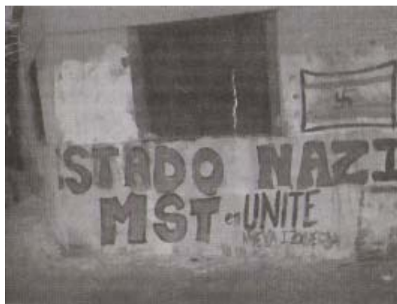
Pintada del MST («Movimiento Socialista de los Trabajadores»)

Según se rumorea, es fluida la relación entre núcleos de ex montoneros y la mezquita regida por este religioso. Algunos de ellos se habrían convertido al Islam.