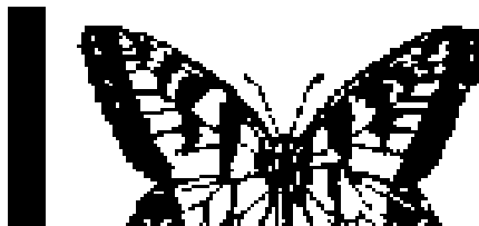
DISARMO #14. DISOLUCIÓN.