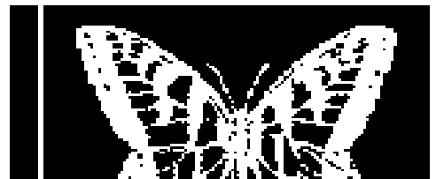
DISARMO #14. DISOLUCIÓN.

Este último número no intenta ser un arrepentimiento ni una renuncia, sino que humildemente se intenta poner en evidencia, desde el ejercicio de la crítica y la auto-crítica, las pequeñas avalanchas de "nuevas" ideas a las que ésta como otras publicaciones, grupos o personas nos hemos expuesto en los últimos tiempos. Crítica y auto-crítica necesarias para avanzar, no para justificar la inactividad porque "todo esta perdido" . Muchas veces la crítica viene como anillo al dedo para desechar cualquier forma de lucha y pasar a una especie de "pasividad crítica"