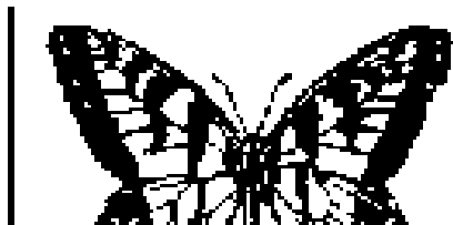
DISARMO #14. DISOLUCIÓN.

Por eso mismo en el sitio web Mariposas del Caos se han hecho correcciones mínimas a algunos de los textos de los números que han seguido siendo difundidos de esta publicación (Disarmo desde el número 09 al presente).