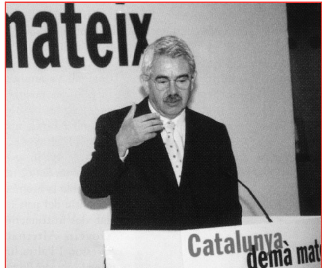
P. Maragall es consolida com a proper President de la Generalitat de Catalunya.

DADES DE SONDEIG: Empresa: Voxpública - Tècnica d'investigació: Entrevista telefònica assistida per ordinador. - Àmbit geogràfic: Catalunya. - Univers: Individus de 18 i més anys residents a llars amb telèfon en l'àmbit geogràfic considerat. - Nombre d'entrevistes: 600 - Error de la mostra: L'error mostrat associat a un nivell de confiança del 95,5% (2 sigma) i p=q=50\% és del \pm 4,08 . - Tipus de mostreig: Estratificat per dimensió de municipi. Selecció de llars aleatòria. Selecció dels individus segons quotes de sexe i edat representatives de la població. Treball de camp: 27, 28 i 29 de novembre.